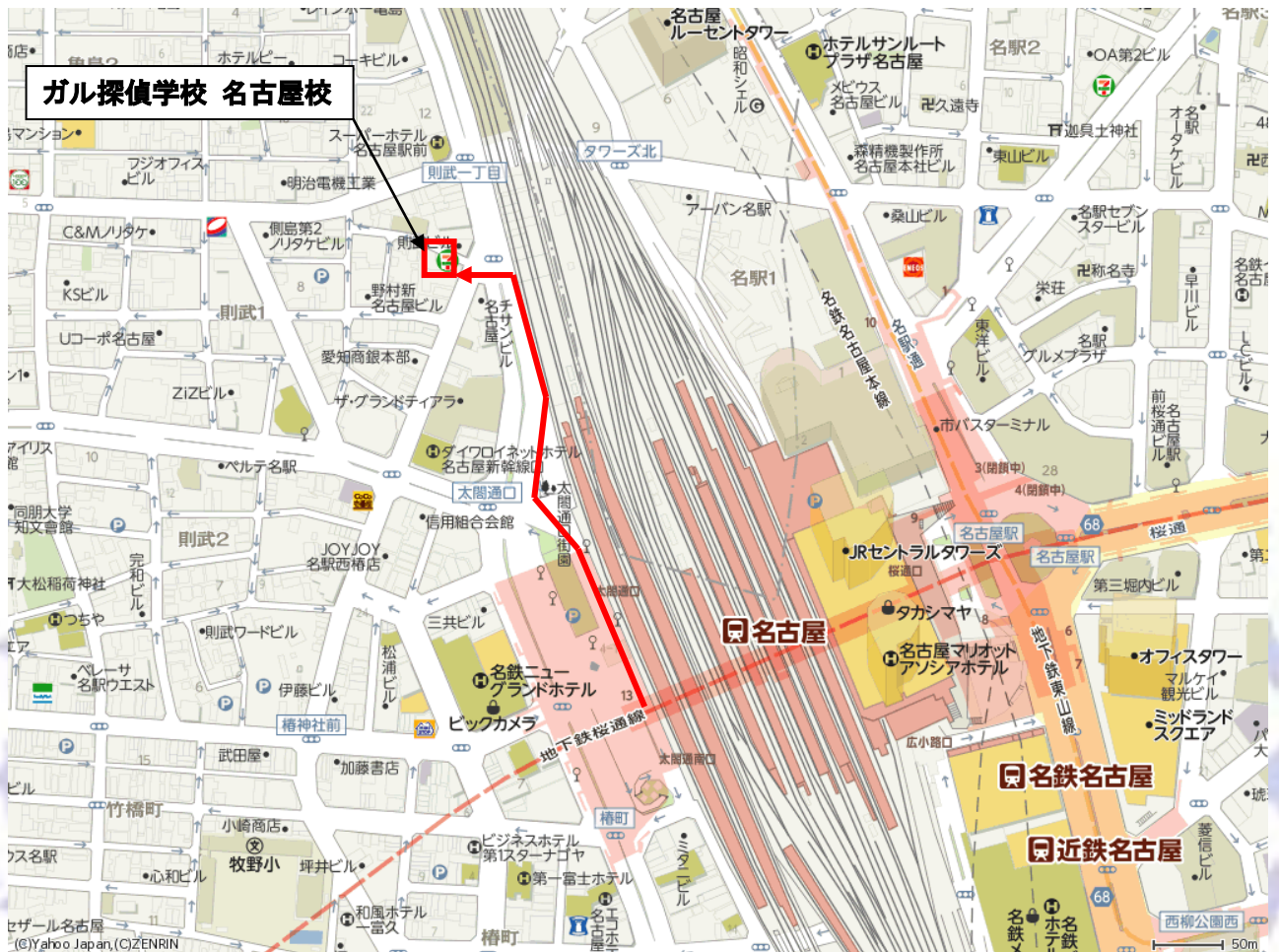
【 □ ガル探偵学校 名古屋校 →最短移動経路】